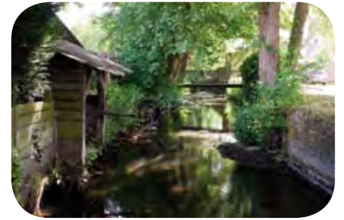
Le bras des Tanneurs : c'est Le cours naturel de la Risle, parallèle à la rue des Tanneurs.

Comme dans de nombreuses villes, La Risle a vu décroître sa fonction traditionnelle et L'Aigle a peu à peu oublié son cours d'eau et ses rivages. La Risle a été un élément structurant de la ville et en marque encore, de manière visible ou non, profondément le paysage.