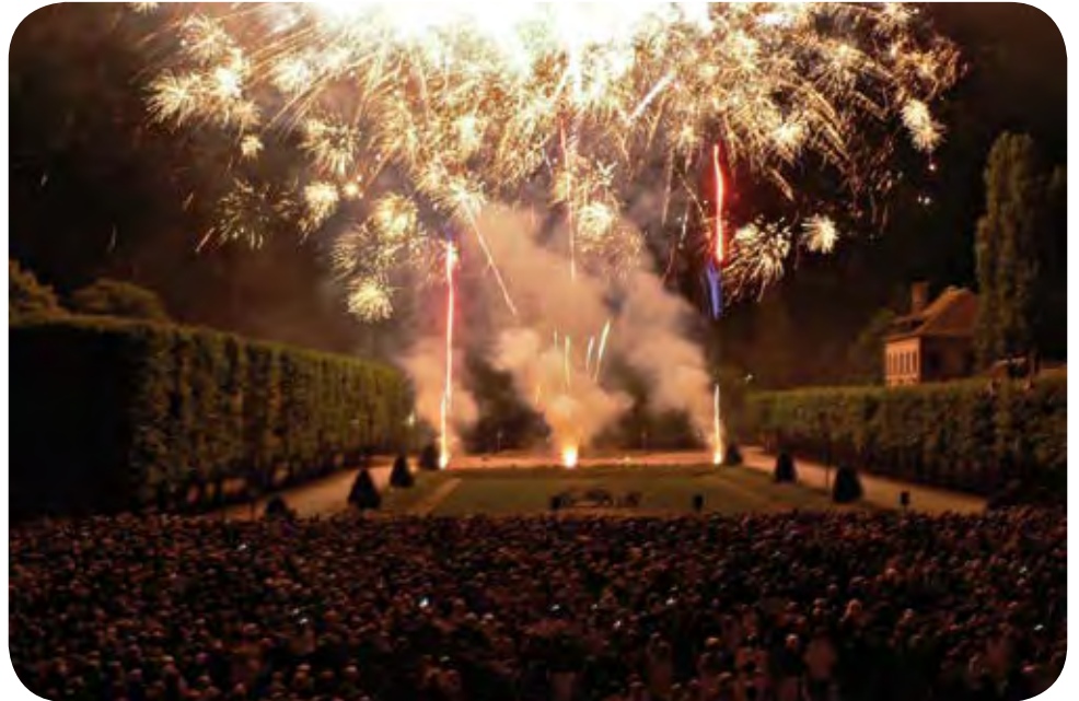
Feu d'artifice 2010, place de la Mairie

Le trio Mary-Lou ouvrira la soirée avec un concert aux sonorités folk à partir de 21 heures dans la cour de l'école Mazeline et dès 22h30 le film Avatar sera projeté sur un écran géant en plein air dans le jardin public. Pensez à apporter votre chaise et votre couverture! En cas d'intempéries, la séance sera reportée au Grû.