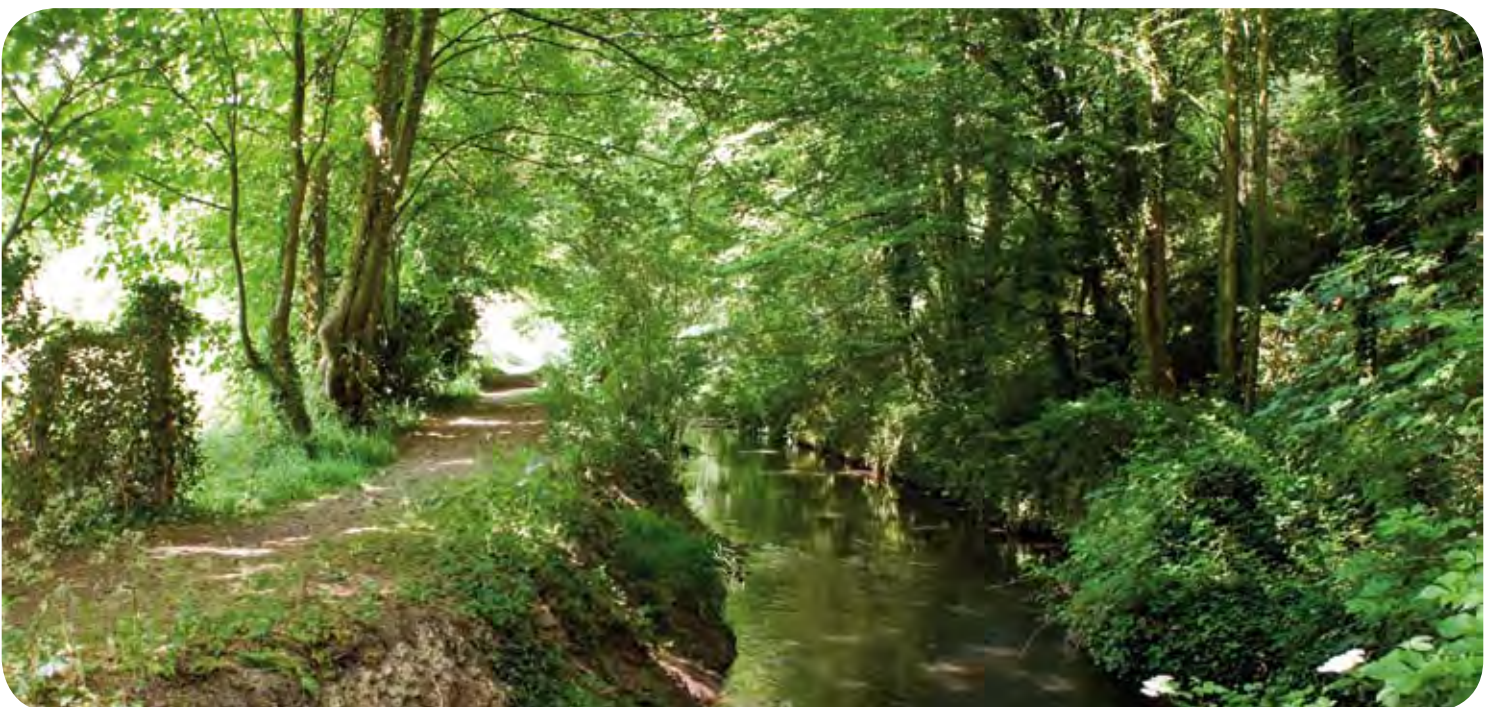
Le bras du Chesnay : canal de dérivation qui longe le talus de la voie ferrée. Aménagé aux XIV e et XV e siècles, il renforce les défenses de la ville et la protège des inondations.