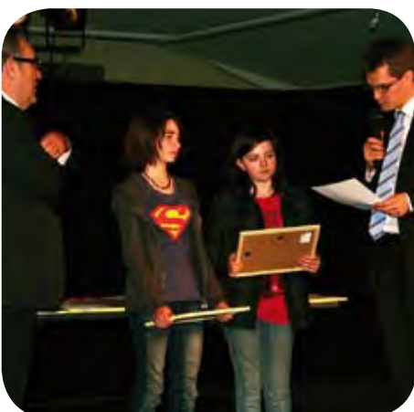
Remise de prix du concours d'affiche