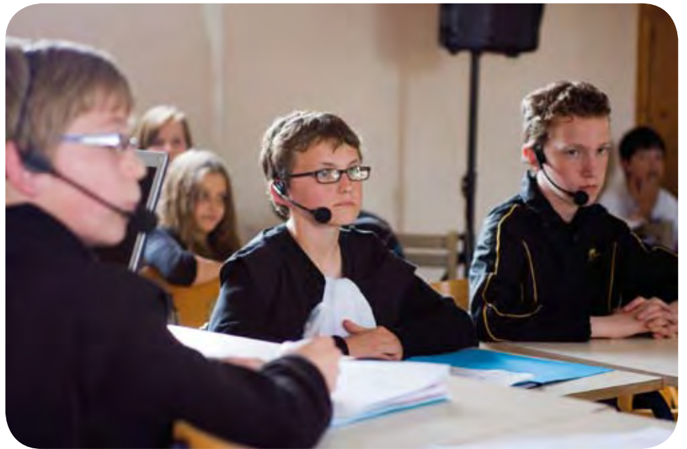
Reconstitution d'un procès au collège Dolto