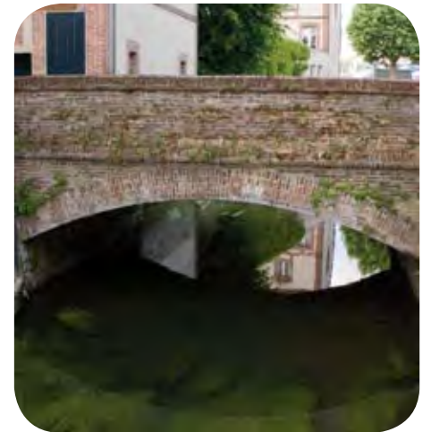
Patrimoine fluvial de L'Aigle : les ouvrages d'art (ponts, passerelles, maçonneries de berges) constituent un patrimoine au même titre que les bâtiments anciens de L'Aigle.