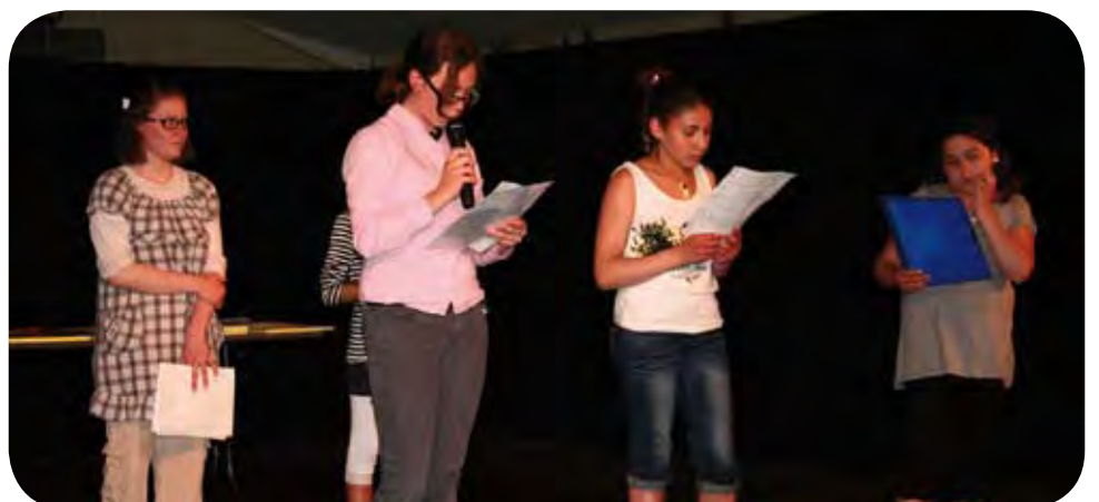
Première scène pour les jeunes « slam »euses de l'association Unicités