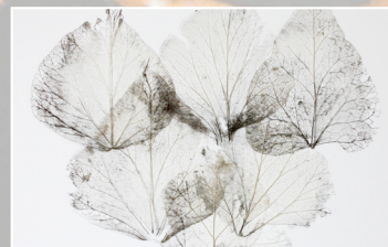
After widding - Nervures de lierre oxydées - pose à taquets - 50x50 cm encadrée - 2015

La plasticienne explore les structures intérieures, les architectures singulières, les textures discrètes. Elle sonde les matières subtiles, les tissures délicates et les territoires dérobés et recherche la quintessence ; la quintessence qui est la partie secrète et qui ne sera révélée qu'après plusieurs processus et opérations successives et parfois un peu audacieuses.