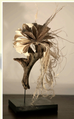
Sapere Aude - Papier et fibres d'iris, bois de tamaris - 40cm x 23cm x 15cm - 2017

La plasticienne explore les structures intérieures, les architectures singulières, les textures discrètes. Elle sonde les matières subtiles, les tissures délicates et les territoires dérobés et recherche la quintessence ; la quintessence qui est la partie secrète et qui ne sera révélée qu'après plusieurs processus et opérations successives et parfois un peu audacieuses.